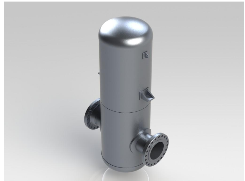
Separador de umidade por impacto

Nos casos em que a pressão e a temperatura do vapor são muito elevados, a VMF fabrica este equipamento em aço liga.