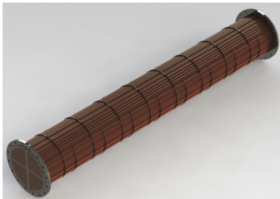
Feixe tubular de um trocador casco e tubos

Temos centenas de fornecimentos que confirmam a performance de nossos trocadores.